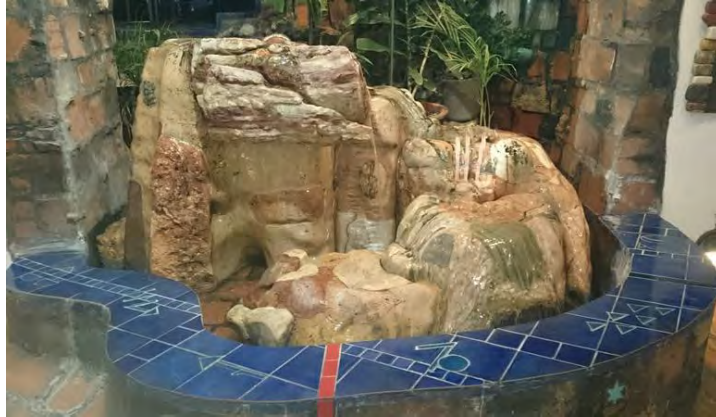
Hundertwasser evi, Zodyaklı çeşme, Viyana

Genel olarak bu dönemde sanatçıların da kendilerini spiritüel konulara daha çok açtığı görülür. Astroloji yeni bir anlam kazanmıştır, çünkü kendini temelden yenilemiştir. Astroloji, bu yüzyılda psikolojiye yaklaşmış ve yaşama destek sunar hale gelmiştir.