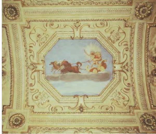
Prag'daki Wallenstein sarayı, Güneş

Dünyevi tarzda olan Barok prensleri de saraylarında astrolojik sembollere yer vermekten geri kalmamışlardır. Merkezlerden birisi Kayzer II. Rudolf'un (1552 – 1612) ikamet ettiği Prag şehridir. Kayzer II. Rudolf, sanatı ve bilimi olduğu kadar, ezoterik konuları da çok destekleyen biridir. Bastırdığı paraların bir yüzünde kendi portresi, diğer yüzünde ise ekliptik ve yükselen burcu Oğlak yer alır. Kepler tarafından hazırlanan natal haritası, birtakım sanat eserlerine, örneğin suluboya resimlere, temel teşkil etmiştir.