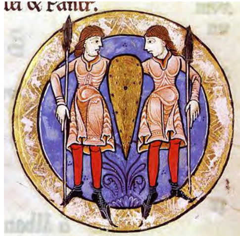
Avcı Zebur* , İkizler, İS. yaklaşık 1170

Kilise ile astroloji arasındaki sıkı bağlantıya diğer bir örnek, "Avcı Zebur" olarak adlandırılan eserdir. Bu eser Romanesk kitap sanatı açısından özel bir anlama sahiptir; rahip ve tarihçi Hieronymus'un İncil çevirisinden (Vulgata) 150 mezmur ( psalm ) içerir; ayrıca içinde İncil'den başka metinler ve dualar bulunmaktadır. Metinlerin ve resimlerin önüne zodyaktaki oniki burcu içeren bir takvim yerleştirilmiştir.