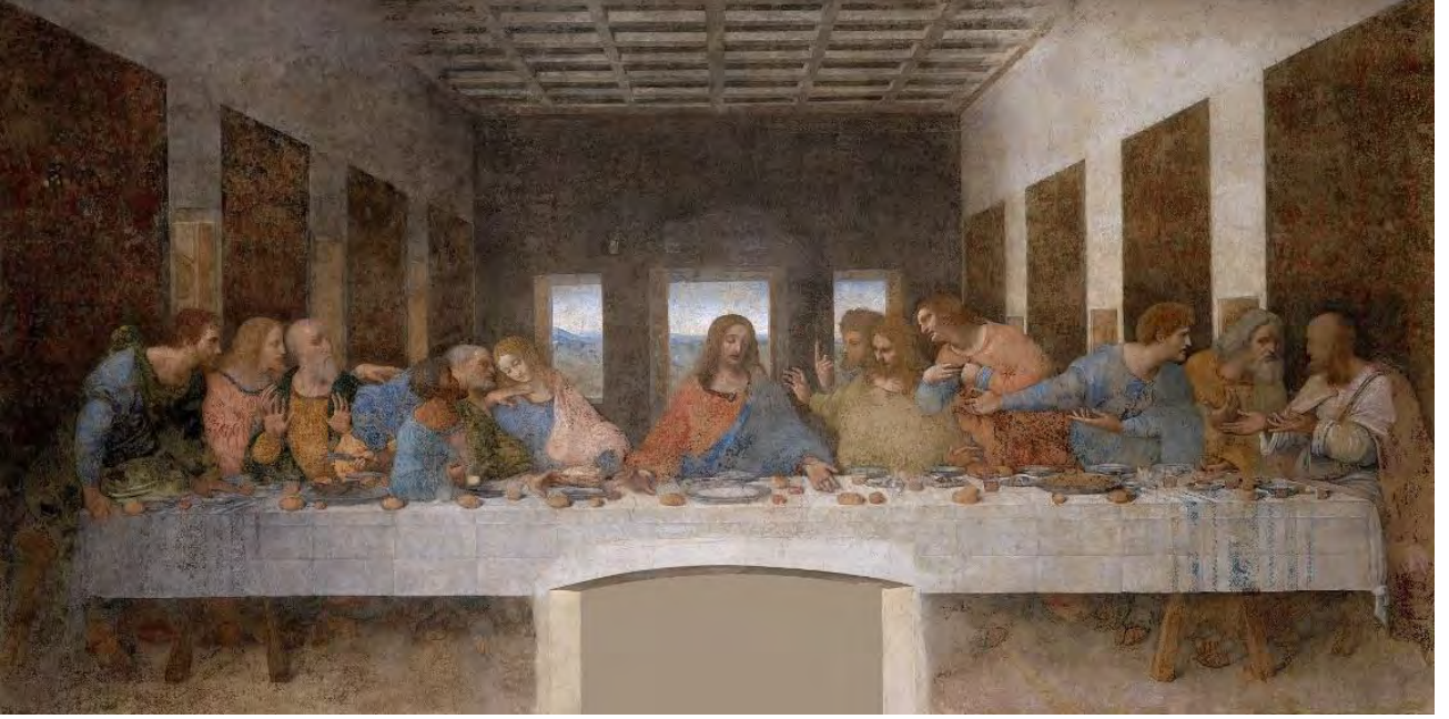
Da Vinci'nin "Son Akşam Yemeği" adlı eseri