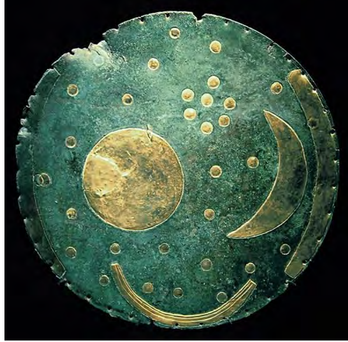
Nebra'daki gökyüzü levhası

Güneş'i, Ay'i ve yıldızları temsil eden bronzdan yapılmış disk, İÖ. yaklaşık 1600