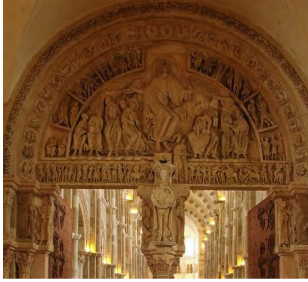
Madeleine Katedrali'nin tympana* (alınlık tablası) bölümü, Vézelay